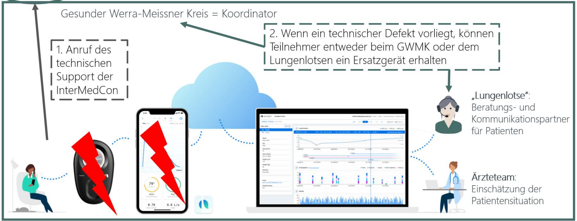
Abbildung 2: Ablauf bei technischen Problemen

Ärzte team: Einschätzung der Patientensituation