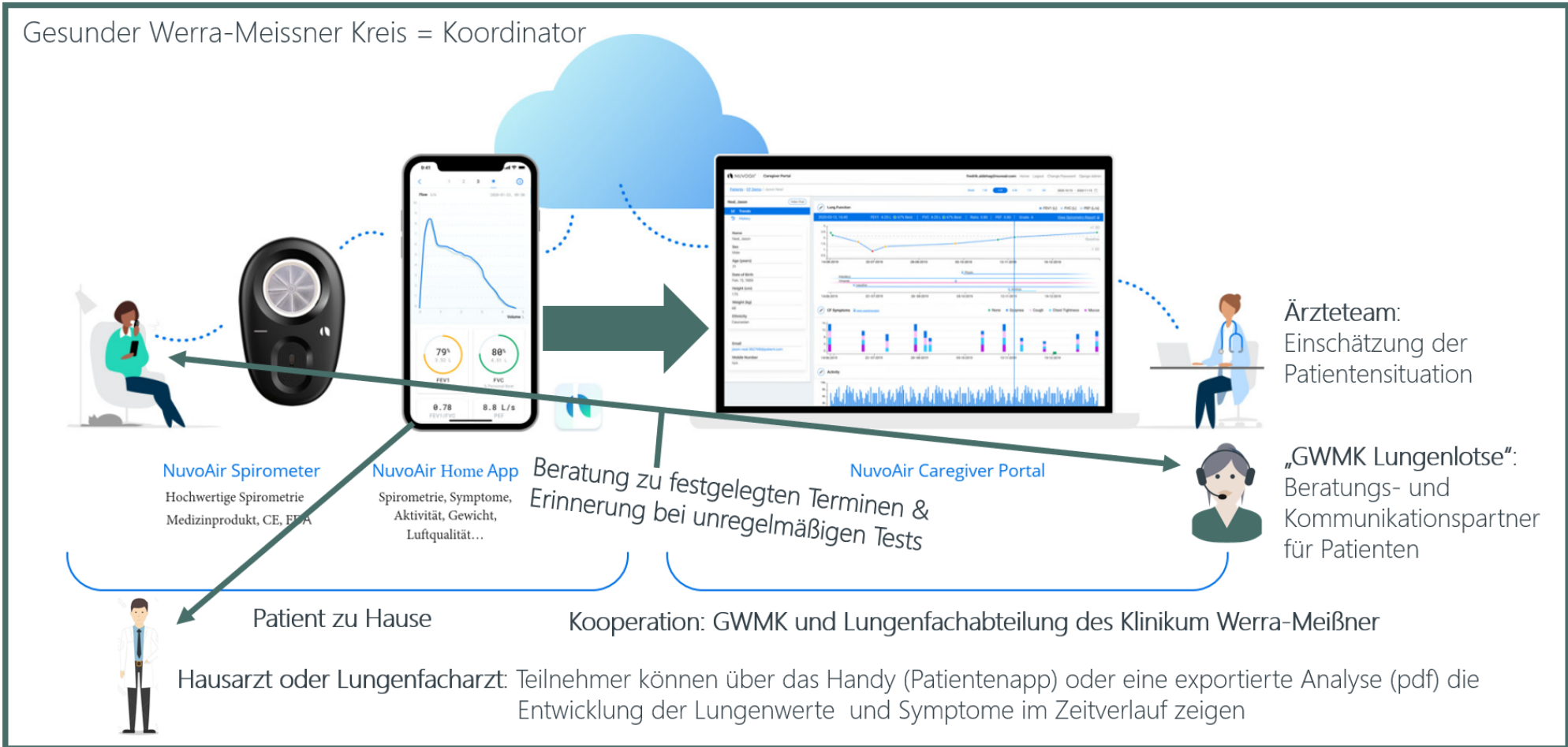
Abbildung 1: Ablauf von „Durchatmen, trotz COPD“

Gesunder Werra-Meißner Kreis = Koordinator